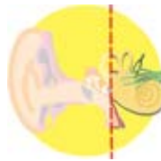
Orella interna Oído interno