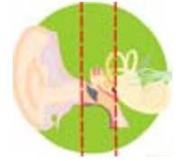
Orella mitjana Oído medio