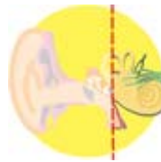
Orella interna Oído interno

Vibration اهتز Dardara egin Вибрирам Vibrer Vibrar Vibrare Wibracja Vibrar A vibra Вибрирует Вібрувати ارتعاش Lökh 震蕩