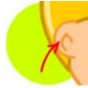
Pavelló de l'orella Pabellón auditivo

Skull جمجمة Garesur Череп Crâne Cranio Cranio Czaszka Crânio Craniu Череп Череп كهوپڑى Ворр 头颅