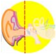
Orella externa Oído externo

Outer ear الأذن الخارجية Капро-belarri Външно ухо Oreille externe Oído externo Orecchio esterno Ucho zewnetrzne Ouvido externo Ureche externă Внешнее ухо Зовнішнє вухо كان كا بيرونى حصه Cibiti nopp-bi 外耳